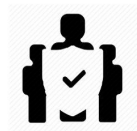
Säkra digitala möten